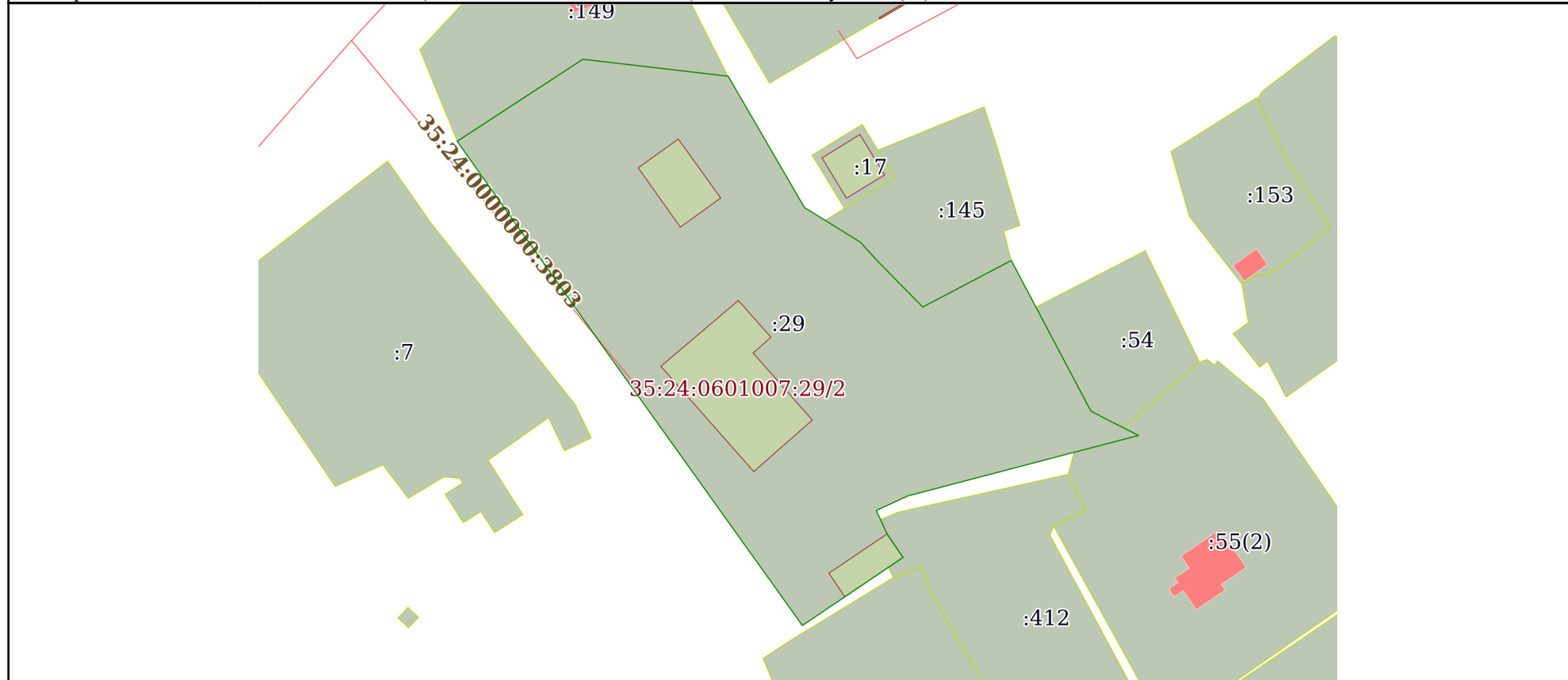
Схема расположения объекта недвижимости (части объекта недвижимости) на земельном участке(ах)