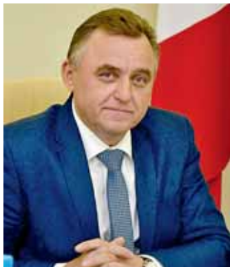
Евгений Шулепов, глава города Вологды